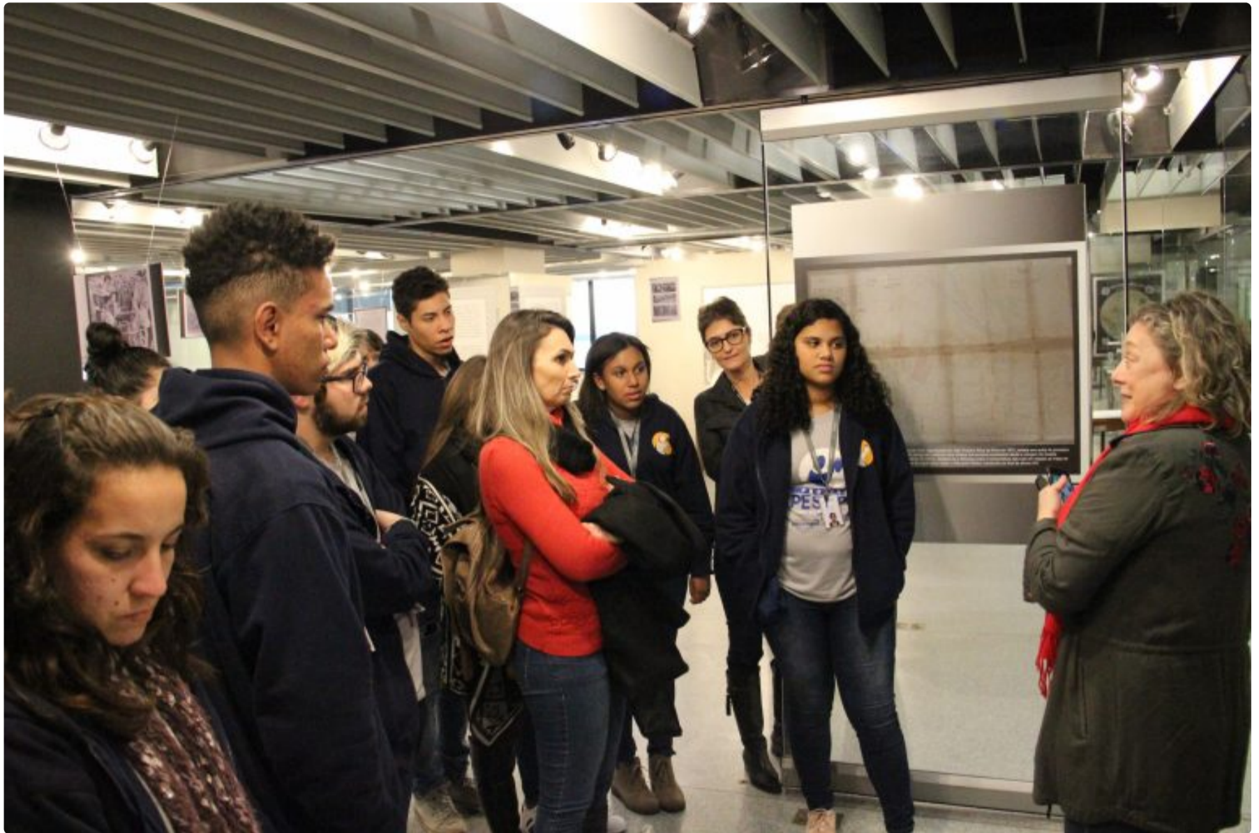
Alunos conheceram Memorial da JFRS