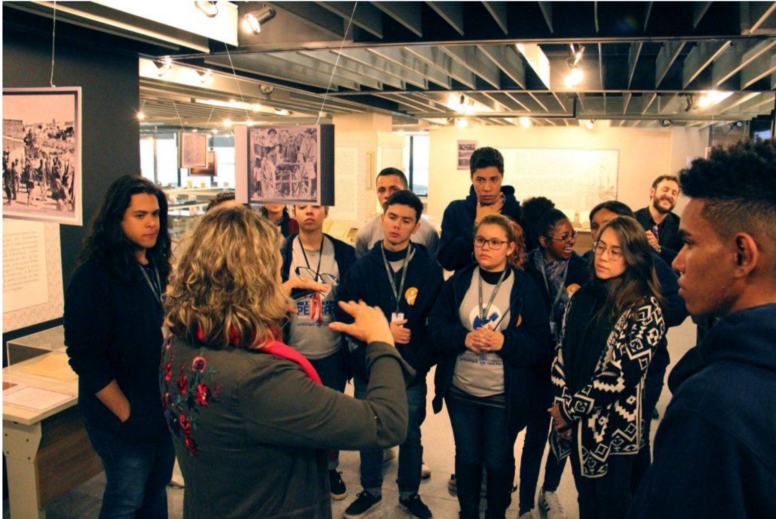
Estudantes receberam informações sobre o funcionamento da Justiça Federal

O Projeto Pescar é um programa que desenvolve as competências pessoais e profissionais de jovens estudantes com vistas à sua inserção, manutenção e ascensão no mundo do trabalho. A turma que esteve na Justiça Federal é composta por alunos de várias escolas, mas que possuem em comum o interesse no meio jurídico/administrativo.